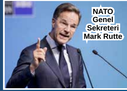
NATO Genel Sekreteri Mark Rutte

NATO Genel Sekreteri Mark Rutte, İttifak'taki yeni hava araçlarının genel olarak NATO bünyesinde üretildiğini ve Atlantik'in her iki yakasında da istihdam yarattığını belirterek, "İşte transatlantik işbirliği böyle işliyor." dedi.