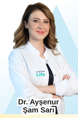
Dr. Ayşenur Şam Sarı

Zi- Aynaya baktığınızda gördüğünüz ince kırışıklıkların, cilt lekelerinin ve elastikiyet kaybının ne kadarı yaşınızdan kaynaklanıyor dersiniz? Çoğumuz bunları yaş almanın kaçınılmaz bir sonucu olarak görüyoruz. Oysa uzmanlara göre cilt yaşlanmasının en önemli nedenlerinden biri takvim yaprakları değil, yıllar boyunca korunmasız maruz kaldığımız güneş ışınları. Dermatolojide "fotoyaşlanma" olarak adlandırılan bu süreç, cildin biyolojik yaşından daha yaşlı görünmesine neden olurken, uzun vadede cilt kanseri riskini de artırabiliyor. Güneşten korunmanın yalnızca estetik bir tercih olmadığına dikkat çekerek Acıbadem Life Danışmanı Dermatoloji Uzmanı Dr. Ayşenur Şam Sarı, "Güneşten korunmak cildin sağlıklı yaşlanmasını sağlayan ve etkili alışkanlıklardan biridir. Üstelik cildinizi koruyan bir güneş kreminde bakmanız gereken ilk özellik, çoğu kişinin sandığı gibi yalnızca SPF değeri değil" uyarısında bulunuyor.