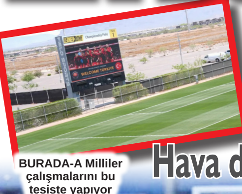
BURADA-A Milliler çalışmalarını bu tesiste yapıyor

Hava durumu kafitemizin günlük yaşamını engelliyor