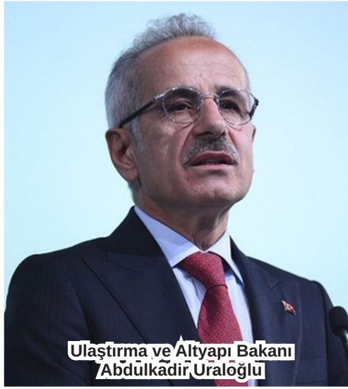
Ulaştırma ve Altyapı Bakanı Abdulkadir Uraloğlu

YÜK TRENLERİ ÜZERİNDEKİ İŞLETME KISITLARI KALDIRILACAK Uraloğlu, T26 Tüneli ile Anka-