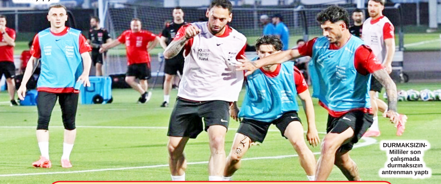
DURMAKSIZIN-Milliler son çalışmada durmaksızın antrenman yaptı