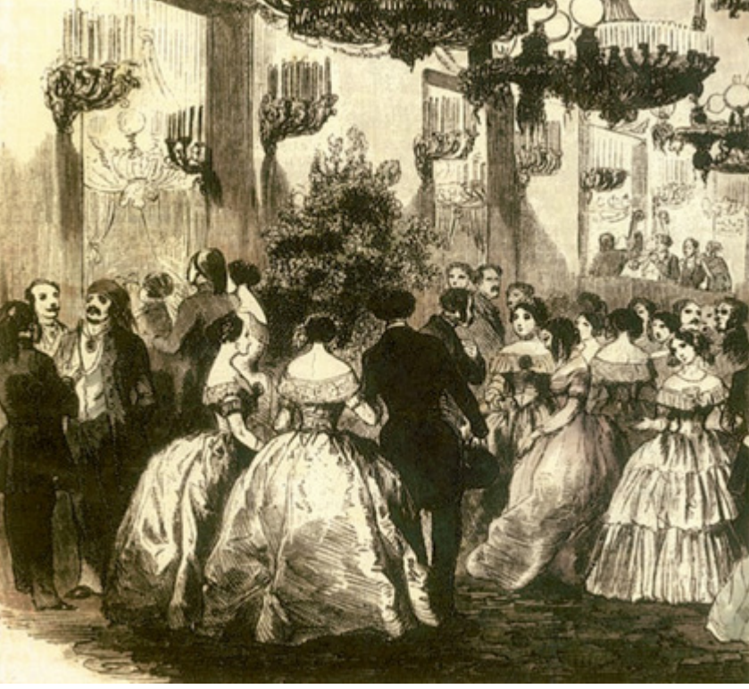
Osmanlı hükümdarlığı, 19. asrın ikinci yarısından itibaren Topkapı Sarayı'nı terk ederek Dolmabahçe'deki yeni sarayı daimi ikametgah olarak kullanmışlardır. Abdülmecit'in yaptırdığı Dolmabahçe Sarayı, bazı söylentilere göre 70 milyon fransa mal olmuştur.

1 2 3 4 5 6 7 8 9 10 11 12 13 14 15 1 K O N A K G İ B İ Ç E L İ K 2 İ A Y R I Ğ İ N L E M İ R İ 3 S A L E D İ N M E K M O R 4 A L A C A A Ş İ K E B A N A 5 L A N E T L E Y C A N İ 6 T L F İ D E L E M E L D 7 M A T A F O R A A K S A T A 8 A M E L Z İ Y A N İ M A L 9 L A Z İ M E A B E S L A N G 10 İ K A R A S İ N A V Y A 11 G E T İ R İ H K A F E S 12 B A R İ T O N A D A N A L I 13 İ L E İ N İ S Y A L S İ Z 14 B A C A N A K A T İ C İ C 15 İ T İ C İ A R T A K A L M A