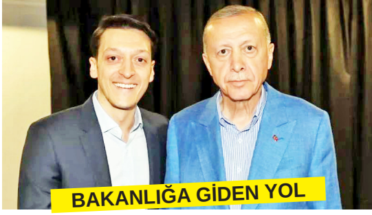
BAKANLIĞA GİDEN YOL

Türkiye'ye geldikten sonra Cumhurbaşkanı Recep Tayyip Erdoğan ile görüşen ve son AKP Genel Kurulu'nda MKYK üyeliğine seçilen Mesut Özil'in, Gençlik ve Spor Bakanlığı'na atanma iht-