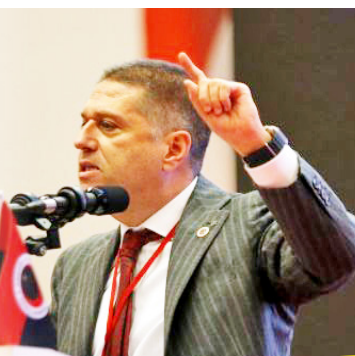
KUVVETLİ YÖNETİMLE GELİYOR