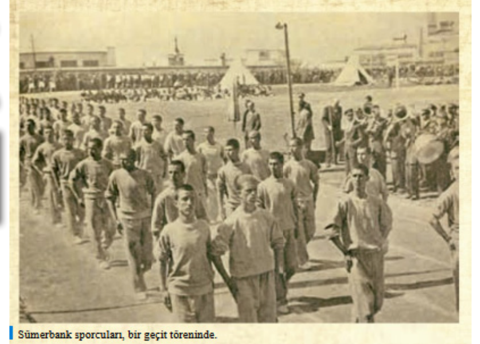
Sümerbank sporcuları, bir geçit töreninde.

ÇOCUK KÜTÜPHANESİ AÇILDI Nazilli'de 2000'lı yılda bile tiyatro yoktu ama 1937 yılında Sümerbank Nazilli