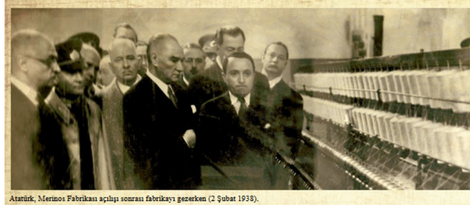
Atatürk, Merinos Fabrikası açılışı sonrası fabrikayı gezerken (2 Şubat 1938).

2- O güne kadar hammadde olarak ihraç edilen ancak mamul ya da yarı mamul hale koyarak değerlendirilebilecek ve sürümü