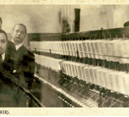
Atatürk, Merinos Fabrikası açılışı sonrası fabrikayı gezerken (2 Şubat 1938).

Temeli 20 Ekim 1934'de atılan fabrika 4 Nisan 1937'de üretime geçti. 18 bin 400 işçi 329 tezgahla çalışan fabrika yılda 35 bin 343 ton iplik ve 6 milyon 350 bin metre bez üretecek kapasitede idi. Fabrikada ayrıca mersevizasyon, kasar, top boyama, iplik boyama ve apre birimleri de vardı. Fabrika enerjisini bünyesindeki termik santralinden ve İvriz Hidro elektrik santralinden alıyordu.