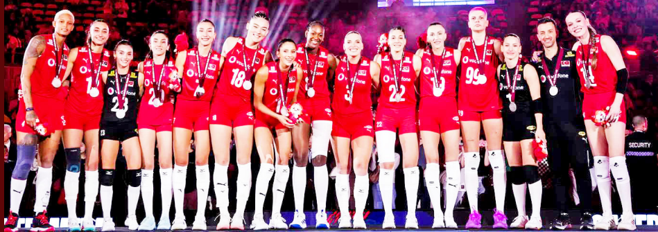
HELAL OLSUN-Dünya ikincisi olan Kadın Voleybol Takımımız