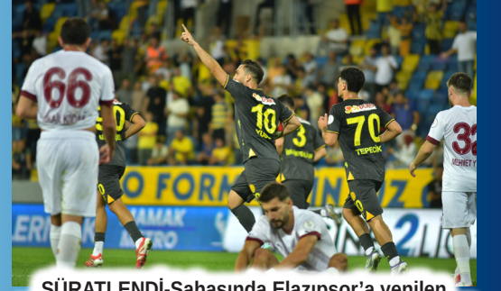
SÜRATLENDİ-Sahasında Elazığspor'a yenilen Ankaragücü futbolcuları hiçbir varlık gösteremedi