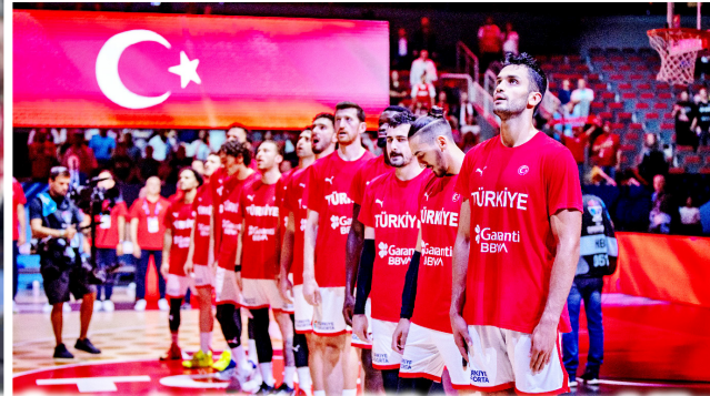
HEDEF BELLİ-12 Dev adam 7'de 7 yapmak için Polonya maçını bekliyor

12 Dev adamımız bugünkü maçı da kazandığında yarı final oynayacak. Saat 17.00'de başlayacak Türkiye-Polonya maçını TRT 1 naklen ekrana getirecek