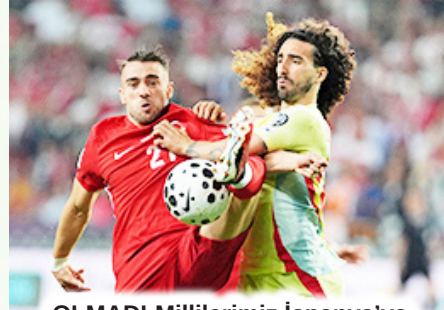
OLMADI-Millilerimiz İspanya'ya karşı varlık gösteremedi

HABER MERKEZİ-FIFA Dünya Grup Eleme maçında Konya'da feci şekilde İspanya'ya 6-0 yenilen A Millî takımımız, şimdi 11 Ekim günü deplasmanda oynayacağı Bulgaristan maçını düşünüyor. 71 yıldır yenemediğimiz Avrupa Şampiyonu İspanya'ya karşı Konya'da ağır bir yenilgi alan A Millî Takımımız 11 Ekim günü deplasmanda Bulgaristan ile oynadiktan sonra, 14 Ekim'de de Türkiye'de Gürcistan ile karşılaşacak. Bu arada grubumuzdaki Gürcistan ise deplasmanda oynadığı maçta Bulgaristan'ı 3-0 mağlup etti.