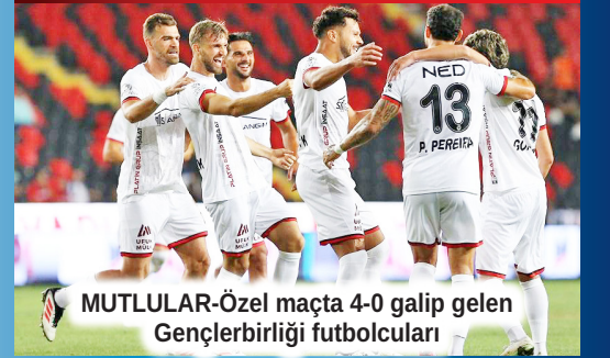
MUTLULAR-Özel maçta 4-0 galip gelen Gençlerbirliği futbolcuları