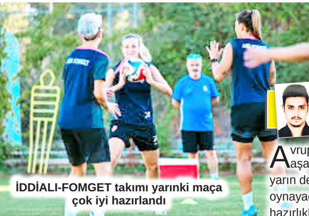
İDDİALİ-FOMGET takımı yarınki maçı çok iyi hazırladı