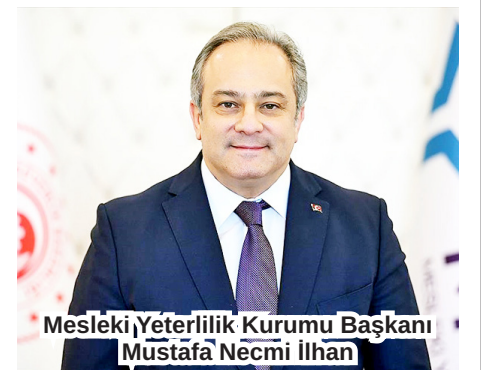
Mesleki Yeterlilik Kurumu Başkanı Mustafa Necmi İlhan

"Yapay zeka, büyük veri, siber güvenlik gibi becerilerin yanı sıra analitik düşünme, liderlik ve iş bileşenleri ön plana çıkıyor. Dünya artık çok mekanik, robotik insanlar istemiyor. Dijital dönüşüm kapsamında, yapay zeka bileşenlerini kullanma ve siber güvenlik becerilerine, dijital dönüşümün argümanları-