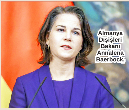
Almanya Dışişleri Bakanı Annalena Baerbock