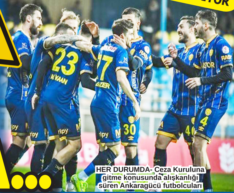
HER DURUMDA- Ceza Kuruluna gitme konusunda alışkanlığı süren Ankaragücü futbolcuları

Disiplin Kuruluna gitme konusunda rekora koşan Başkent takımı son Keçiörengücü Lig karşılaşmasında aynı uygulamaya tabi tutuldu.