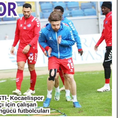
ÇALIŞTI- Kocaelispor maçı için çalışan Keçiörengücü futbolcuları

yukarılara çıkarmak istiyoruz. Bu hedefimize mutlaka varacağız" dedi.