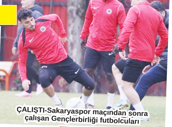
ÇALIŞTI-Sakaryaspor maçından sonra çalışan Gençlerbirliği futbolcuları