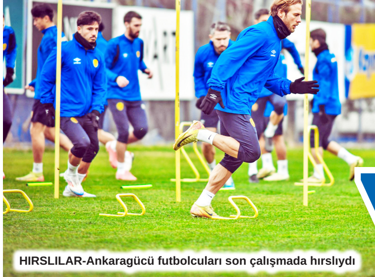
HIRSLILAR-Ankaragücü futbolcuları son çalışmada hırslıydı

Ankaragücü, Erzurum maçında sadece galibiyeti düşünüyor