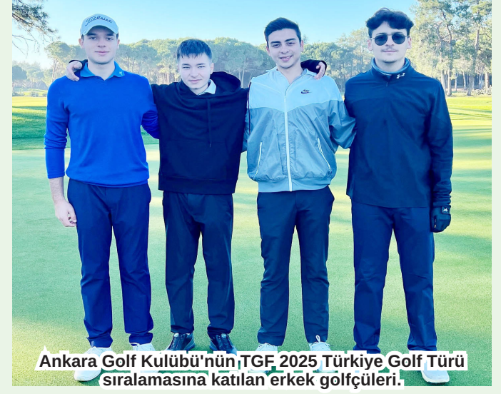
Ankara Golf Kulübü'nün TGF 2025 Türkiye Golf Turu sıralamasına katılan erkek golfçüleri.