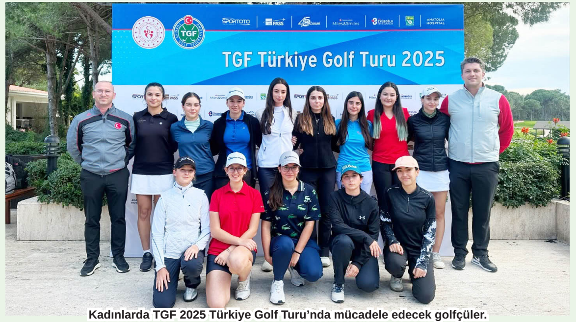
Kadınlarda TGF 2025 Türkiye Golf Turu'nda mücadele edecek golfçüler.