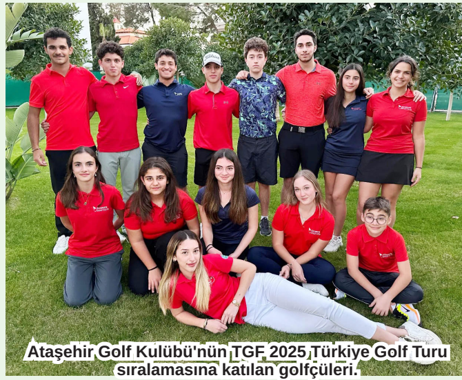
Ataşehir Golf Kulübü'nün TGF 2025 Türkiye Golf Turu sıralamasına katılan golfçüleri.