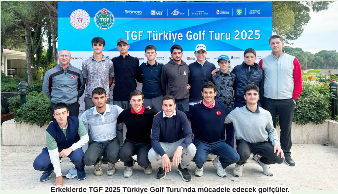
Erkeklerde TGF 2025 Türkiye Golf Turu'nda mücadele edecek golfçüler.