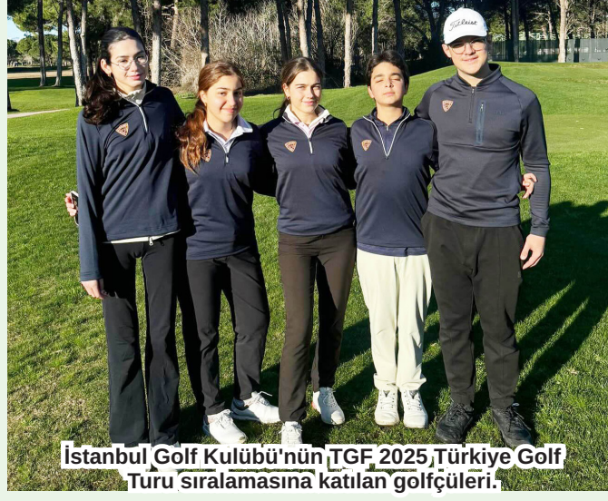
İstanbul Golf Kulübü'nün TGF 2025 Türkiye Golf Turu sıralamasına katılan golfçüleri.