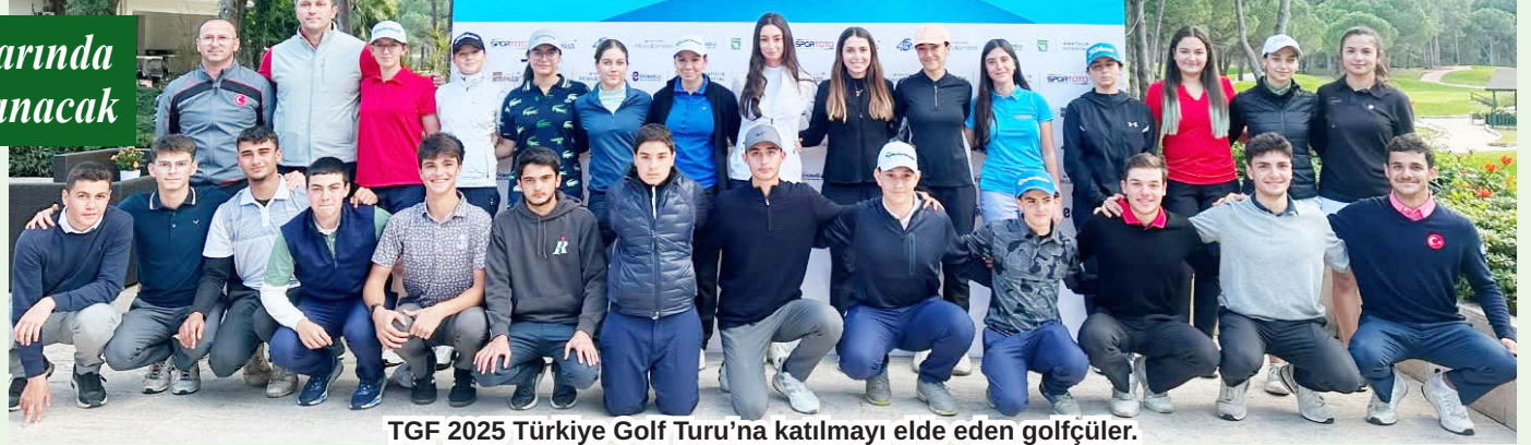
TGF 2025 Türkiye Golf Turu'na katılmayı elde eden golfçüler.

Türkiye Golf Federasyonu tarafından TGF Türkiye Golf Turu için verilecek Wild Card (iki kadın, iki erkek) sporcular ise daha sonra TGF Milli Takımlar Komitesi ve TGF Milli Takım Antrenörleri tarafından açıklanacak. Sıralama müsabakalarında TGF Türkiye Golf Turu'nda oynamaya hak kazanan sporcular, 26 Ocak 2025 tarihinde dek Antalya Belek'te yer alan Robinson Nobilis Otel'de yapılacak Milli Takım Aday Kadro Kampı'yla golf sezonunun ilk çalışmasına başlayacaklar.