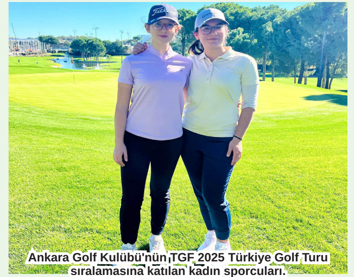
Ankara Golf Kulübü'nün TGF 2025 Türkiye Golf Turu sıralamasına katılan kadın sporcuları.