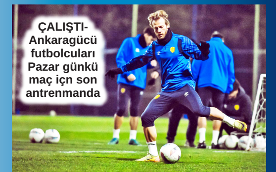
ÇALIŞTI-Ankaragücü futbolcuları Pazar günü maç için son antrenmanda