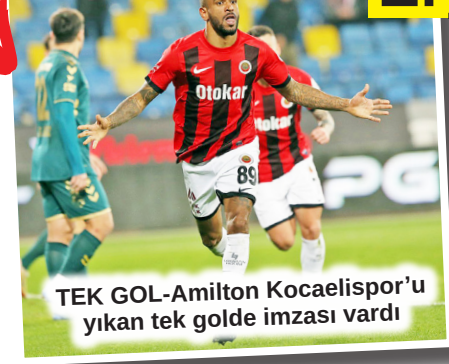
TEK GOL- Amliton Kocaelispor'u yikan tek golde imzası vardı