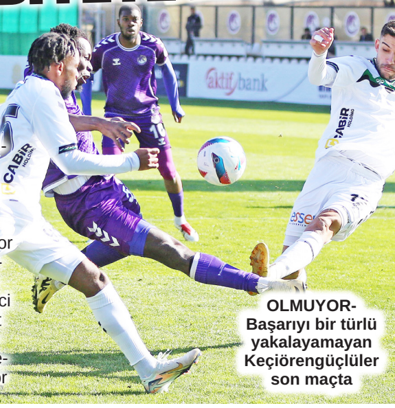
OLMUYOR-Başarıyı bir türlü yakalayamayan Keçiöregüçlüler son maçta

olması ile birlikte ligde üst üste 4'üncü mağlubiyetini aldı. SON GALİBİYET Başkent ekibi son galibiyetini 1. Lig'in 16. haftasında Ümraniyespor karşısında almıştı. Deplasman oynanan mücadelede 27 puanla 11'nci sırada yer alan Başkent takımı Pazar günü deplasmanda zirve mücadelesi veren Bandırmaspor ile karşılaşacak.