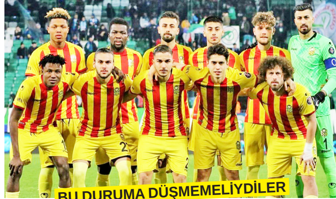
BU DURUMA DÜŞMEMELİYDİLER

inşaatı başladı. Kapasitesi önceleri 45.000, sonraları 50.000 kişilik olarak belirlenen inşaatın 29 Ekim 2025'de bitirileceği iddia edildi. Ancak... Böylesine mükemmel yapılan stadin 2025'de bitirilip, faaliyete geçme ihtimali oldukça uzakta görünüyor. Bu konuda mahcup olmaya hazırım. İnşaatı bitiremeyenler ise, verdikleri sözün altında kalacak mı?