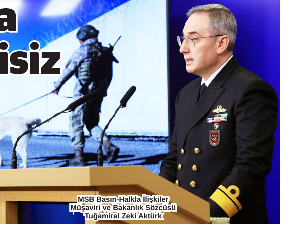
MSB Basın-Halkla İlişkiler Müşaviri ve Bakanlık Sözcüsü Tuğamiral Zeki Aktürk

ny Harekatı'nda şehit verilen 72 Mehmetçik 72 savaş uçagın hava taarruzuyla başlayan, Zeytin Dalı Harekatı'nın 7'inci yılı dönümüne ilişkin, "Güney sınırlarımızda oluşturulmak istenen terör koridorunu parçalayan, hudutlarımızın ve bölge halkının güvenliğini sağlayan Zeytin Dalı Harekatı'nın 7'nci yılı dönümünde canları pahasına mücadeleye eden aziz şehitlerimizi rahmet ve minnetle anıyor, kahraman gazilerimize saygı ve şükranlarımızı sunuyoruz." diye konuştu.