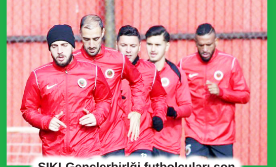
SIKI-Gençlerbirliği futbolcuları son antrenmanda