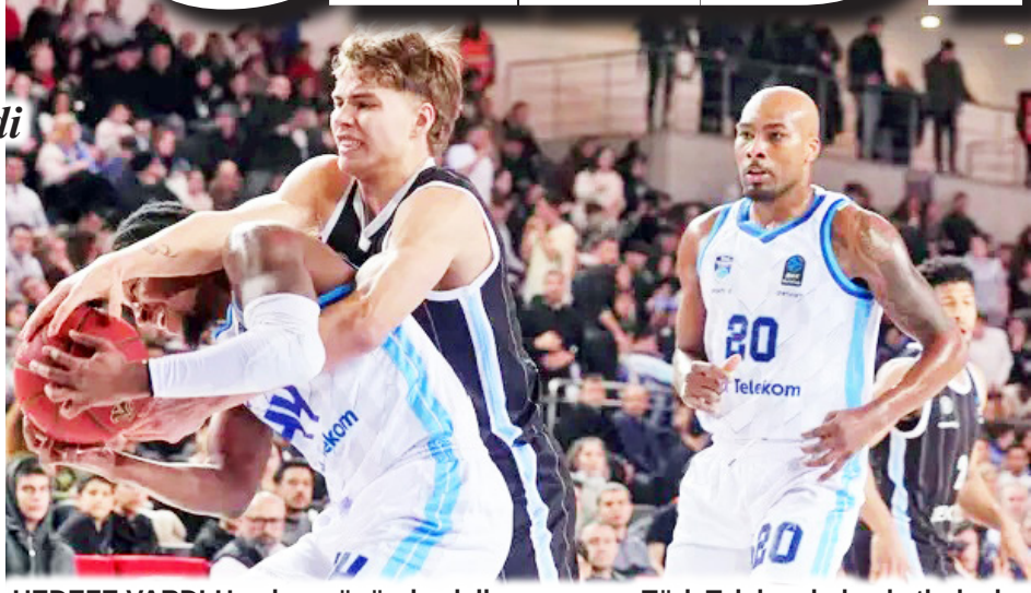
HEDEFE VARDI-Hamburg önünde akıllı oynayan Türk Telekomlu basketbolcular

Türk Telekom Cumartesi günü lig için deplasmanda Beşiktaş ile karşılaşacak. Türk Telekom 21 Ocak günü EuroCup için deplasmanda U-Banca Transilvania ile oynayacak.