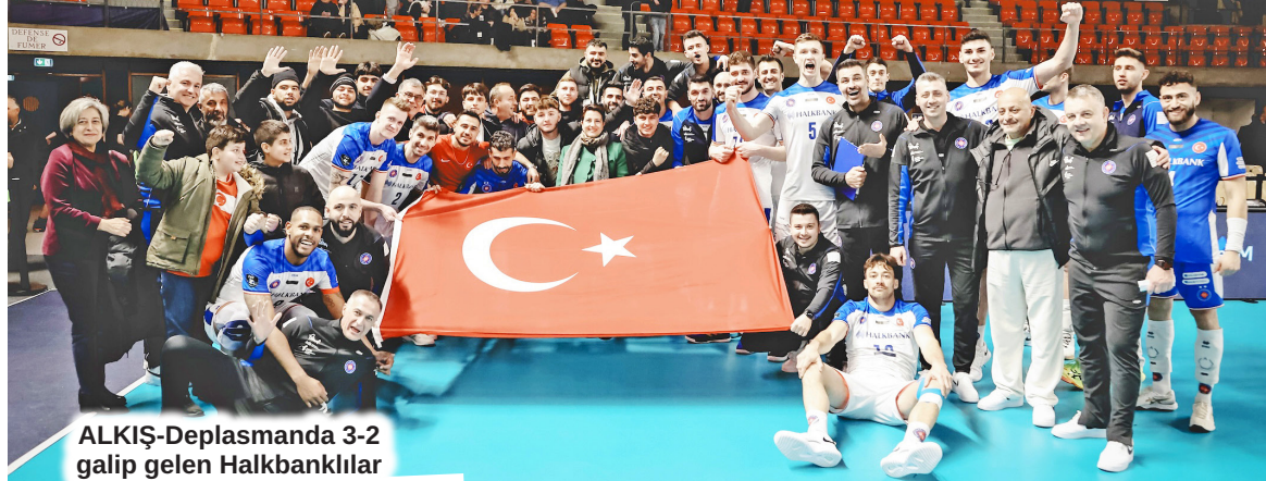
ALKIŞ-Deplasmanda 3-2 galip gelen Halkbanklılar maç sonrasında