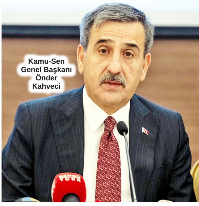
Kamu-Sen Genel Başkanı Önder Kahveci

TÜRKİYE Kamu-Sen Genel Başkanı Önder Kahveci, “Kamu görevlilerin 2025 yılı ücret artışları, kamu alacaklarına uygulanan yüzde 43,93’lük rakama göre yeniden revize edilmeli. Refah payı verilmediği takdirde kamu görevlileri ilk defa hedeflenen enflasyonun altında ücret artışı almış olacaklar. Merkez Bankası’nın 2025 yılı için enflasyon öngörüsü yüzde 21, orta vadeli programda hükümetin hedefi de yüzde 17,5 ama kamu görevlilerine verilen rakam 11,54. Dolayısıyla hedeflenen enflasyonun dahi altında bir ücret artışıyla karşı karşıyayız. Bunun telafi edilmesi gerekir. ÇALIŞANLARIN alım gücünü artırmanın yegane unsuru da refah ücreti vermektir. Yoksa enflasyona dayalı bir ücret sistemi, yani enflasyon kadar ücret artışı yapmak çalışanların alım gücünü artırmaz. Çalışanların biraz nefes alabilmesi, emeklilerimizin rahat edebilmesi adına refah payı ve ek zam ısrarımızı devam ettiriyoruz” diye konuştu. S.3’te