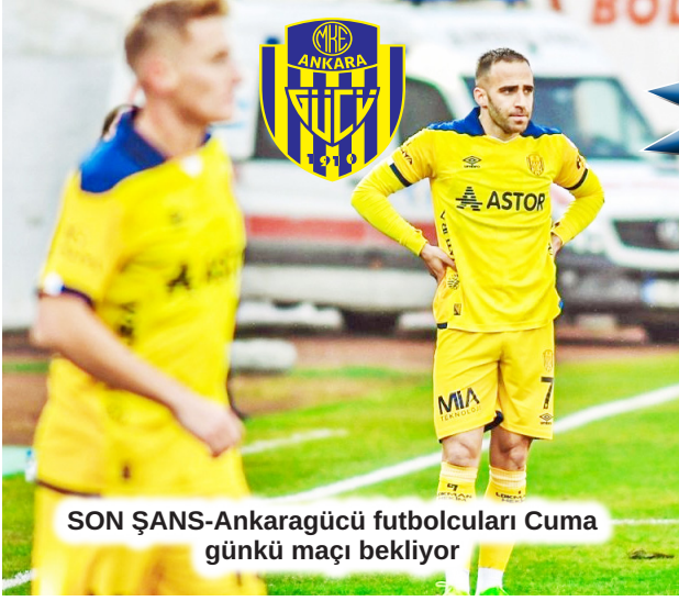
SON ŞANS-Ankaragücü futbolcuları Cuma günkü maçı bekliyor