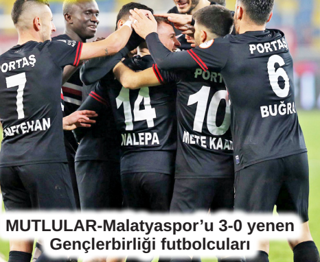
MUTLULAR-Malatyaspor'u 3-0 yenen Gençlerbirliği futbolcuları