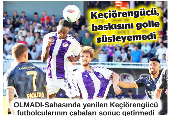
Keçiörengücü, baskısını golle süsleyemedi