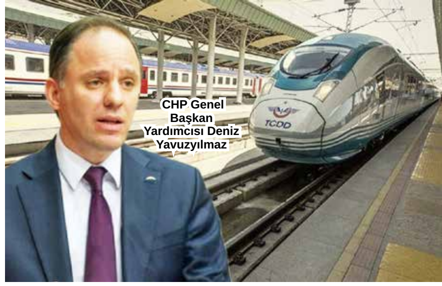
CHP Genel Başkan Yardımcısı Deniz Yavuzylmaz

Yavuzylmaz, şunları kaydetti: "Bugünden geçerli olmak üzere Yavuz Sultan Selim Köprüsü'nde araç geçiş ücretleri 80 liraya çıkarıldı. Bu, yüzde 14 bir zam demek. Çanakkale Köprüsü'nde araç geçiş ücreti 795 lira oldu. Bu, yüzde 36 zam demek. Osmangazi Köprüsü 795 lira, yüzde 43 zam, Avrasya Tüneli 225 lira yüzde 44 zam. Ve AK Parti dönemi