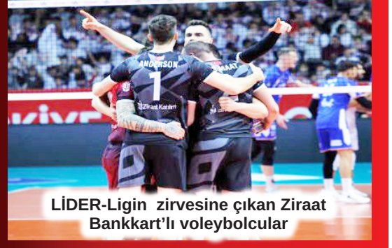
LİDER-Ligin zirvesine çıkan Ziraat Bankkart'lı voleybolcular

HABER MERKEZİ- Başkent Ankara'yı Süper Ligde temsil eden Türk Telekom yarın Hamburg ile karşılaşacak. Ligdeki son maçında Karşıyaka'yı 95-73 yenen Türk Telekom EuroCup'ta Almanya'nın Hamburg takımı ile karşı karşıya gelecek. Türk Telekom-Hamburg maçı 19.30'da Başkent Spor Salonunda başlayacak.