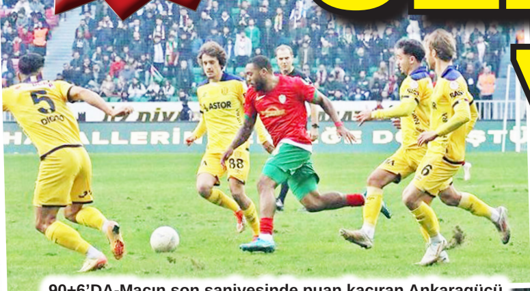
90+6'DA-Maçın son saniyesinde puan kaçıran Ankaragücü futbolcuları Amedspor maçında