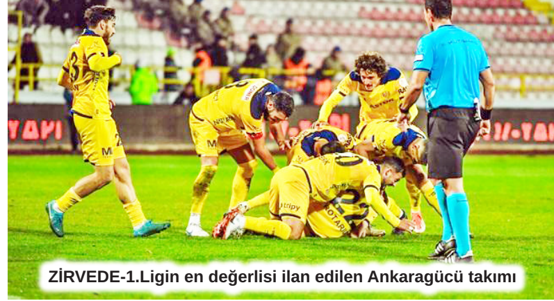
ZİRVEDE-1.Ligin en değerlisi ilan edilen Ankaragücü takımı

HABER MERKEZİ- 1.Lig'in en değerli kulübü Ankaragücü olarak belirlendi.