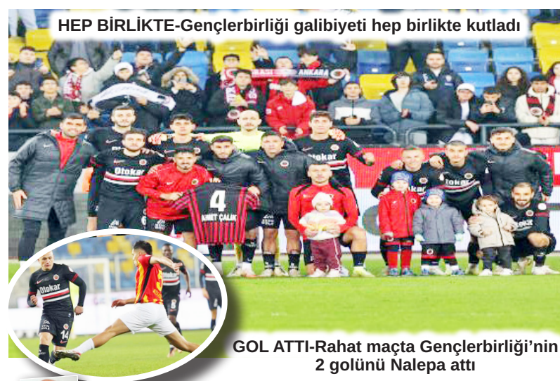
HEP BİRLİKTE-Gençlerbirliği galibiyeti hep birlikte kutladı