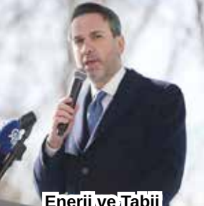
Enerji ve Tabii Kaynaklar Bakanı Alparslan Bayraktar

ANKARA (AA) - Enerji ve Tabii Kaynaklar Bakanı Alparslan Bayraktar, Türkiye'nin komşularıyla şebeke bağlantısını artırmaya çalıştığını belirterek, "Bölgede ve ülkede bir istikrar olması açısından Suriye'ye enerji tedarikimizi artıracacağız." dedi.