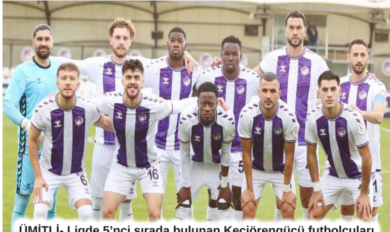
ÜMITLİ- Ligde 5'nci sırada bulunan Keçiöregücü futbolcuları

Başkent takımı 16 maç sonunda dışarıda 16 puan topladı