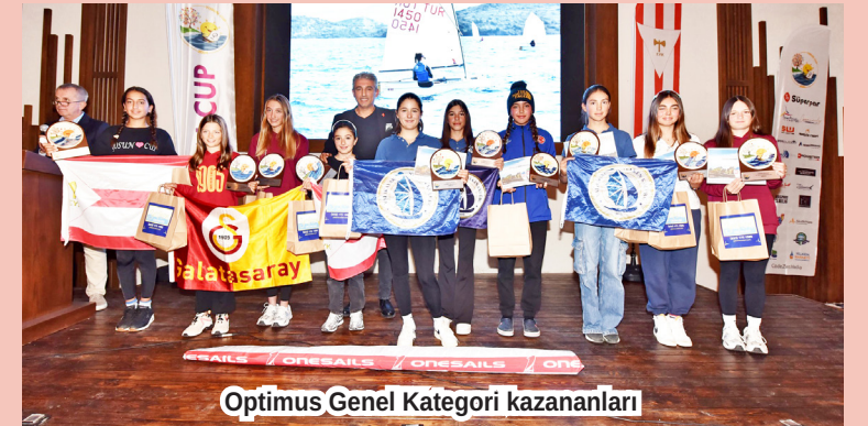
Optimus Genel Kategorisi kazananları