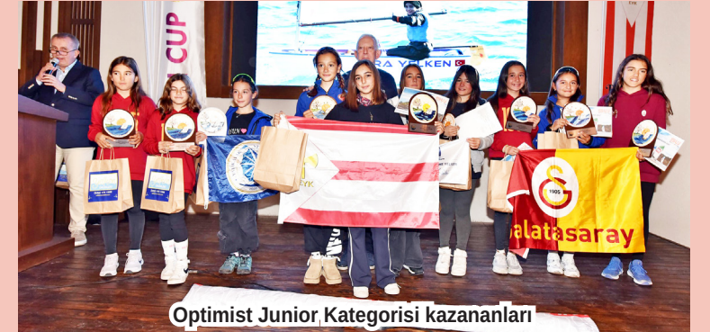
Optimist Junior Kategorisi kazananları