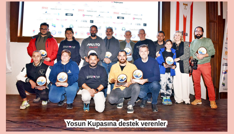
Yosun Kupasına destek verenler