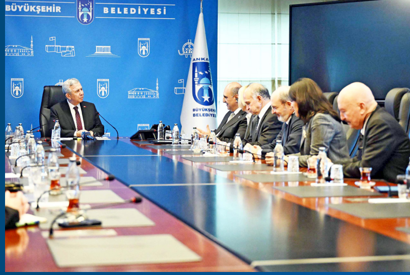
ABB Başkanı Mansur Yavaş, konuşmasının sonunda ise "Hep beraber çocuklarımızın

huzur içinde yaşayacağı bir ülkeye ulaşmak için çalışacağız" diyerek, tüm kamu yöneticilerini daha şeffaf ve vatandaş odaklı çalışmaya davet etti.