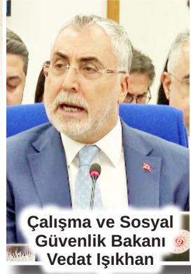
Çalışma ve Sosyal Güvenlik Bakanı Vedat Işıkhhan

MUHALEFET milletvekilleri, "17 bin TL'ye geçinebilir misiniz Sayın Bakan, 30 bin lira yoksa biz de yokuz" diyerek tepki gösterdi. S.3'te