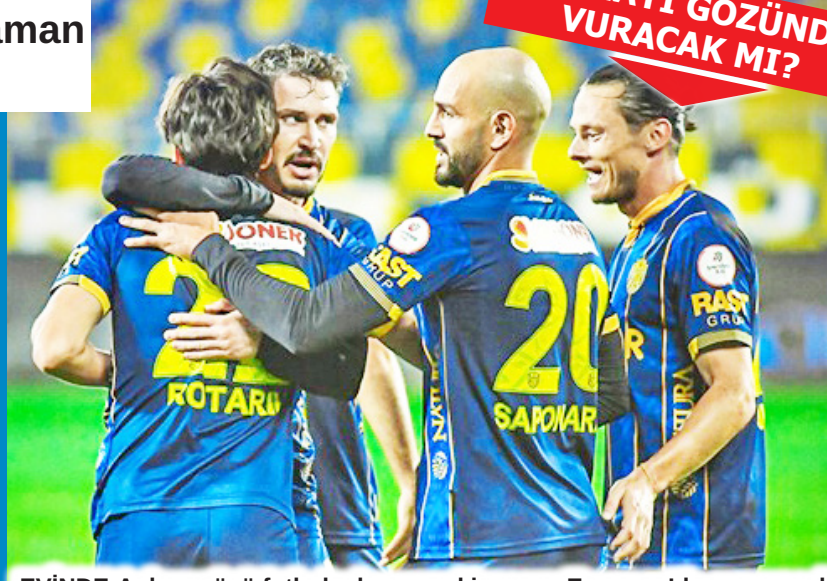
EVİNDE-Ankaragücü futbolcuları yarınki maçını Eryaman'da oynayacak

KUPADAKİ RAKİP Ziraat Türkiye Kupası 3. Eleme Turu'nda eşleşmeler belli oldu. Kupada bu yıl eleme müsabakalarının seribaşı