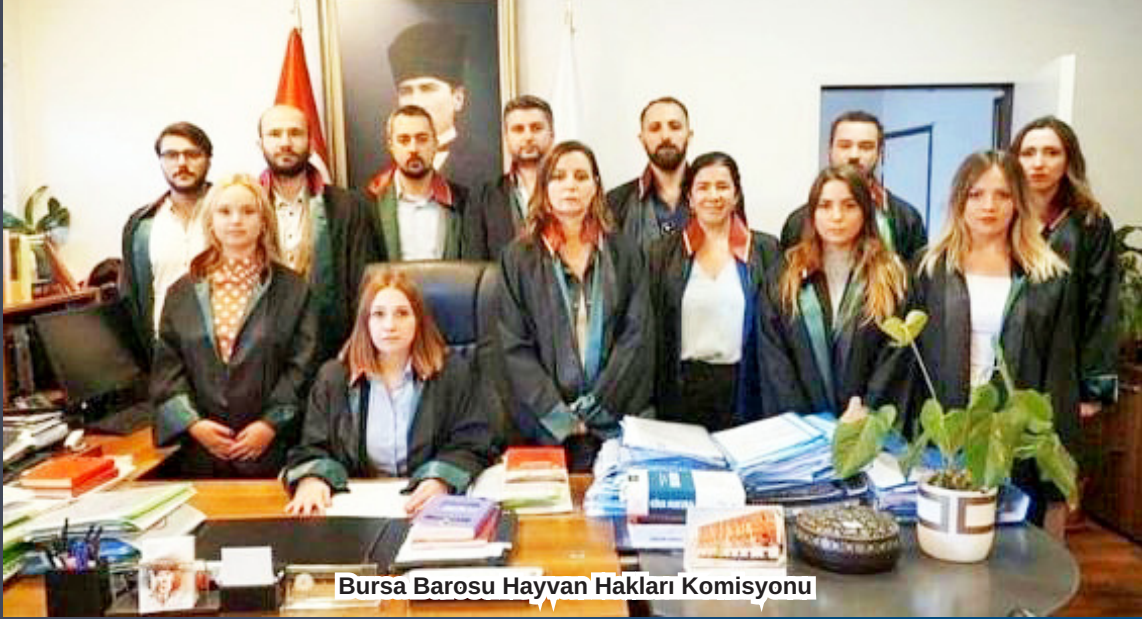
Bursa Barosu Hayvan Hakları Komisyonu

"Kurban Bayramı nedeniyle küçük ve büyük baş hayvanların hayvan pazarlarından satmak için bir ilden diğer bir ile giderken nakil nedeniyle bulaşıcı hastalık taşınma riski vardır. Dolayısıyla taşınan hayvanların tamamının sağlıklı olduğuna dair raporlu olmaları gerekiyor. Nakil sırasında ise taşıdıkları araçta, hele ki uzun yol alınacaksa, çok sıkışık olmamalıdır. Dinlendirilmeli, ihtiyaçları dâhilinde yeme ve suya kolay ulaşabil-