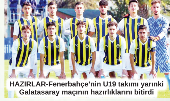
HAZIRLAR-Fenerbahçe'nin U19 takımı yarınki Galatasaray maçının hazırlıklarını bitirdi