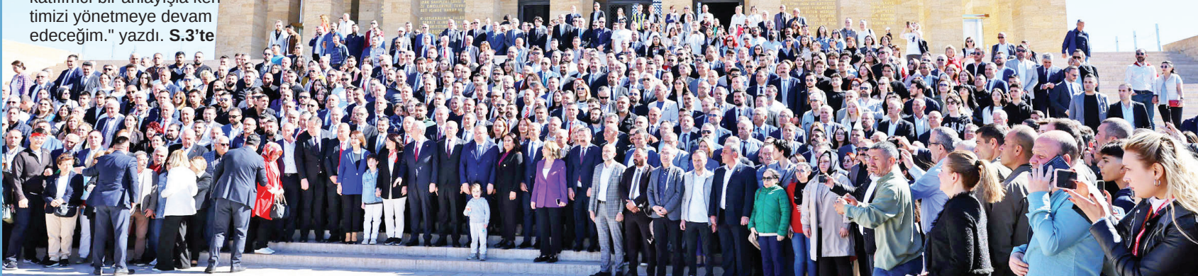
ABB Başkanı Mansur Yavaş:

ANKARA Büyükşehir Belediye Başkanlığına ikinci kez seçilen Mansur Yavaş, CHP'den seçilen 16 ilçenin başkanıyla birlikte Anıtkabir'i ziyaret ederek, Gazi Mustafa Kemal Atatürk'ün manevi huzuruna çıktı. Yavaş, Anıtkabir Özel Defteri'ne "Aziz hatıranız önünde bir kez daha söz veriyorum; bugüne kadar olduğu gibi bundan sonra da kimseyi ayırt etmeden, adil, şeffaf ve katılımcı bir anlayışla kentimizi yönetmeye devam edeceğim." yazdı. S.3'te