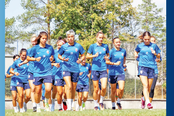
HAZIR-FOMGET'li kadın futbolcular son antrenmanda

Ankara Büyükşehir Belediyesi FOMGET Kadın Futbol Takımı, Süper Ligin tamamlanmasına iki hafta kala yarın Ankara'da Amedspor'u ağırlayacak