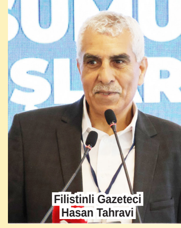
Filistinli Gazeteci Hasan Tahravi