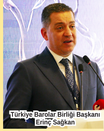
Türkiye Barolar Birliği Başkanı Erinç Sağkan