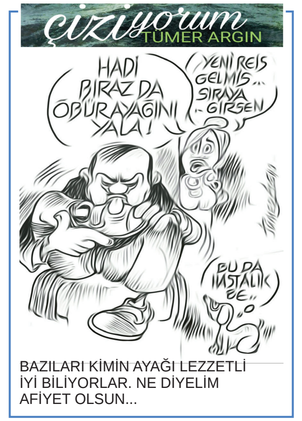
BAZILARI KİMİN AYAĞI LEZZETLİ İYİ BİLİYORLAR. NE DİYELİM AFİYET OLSUN...