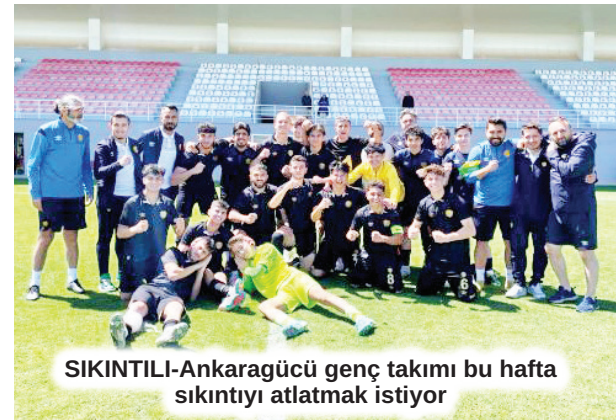
SIKINTILI-Ankaragücü genç takımı bu hafta sıkıntıyı atlama istiyor

ANKARA-(Sporanki)- Ankaragücü U 19 takımı kritik bir haftaya giriyor. Alınabilecek kötü bir sonucun ardından U 19 takımı küme düşme tehlikesi yaşayabilecek.