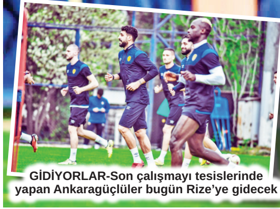
GİDİYORLAR-Son çalışmayı tesislerinde yapan Ankaragüçlüler bugün Rize'ye gidecek

RİZESPOR MAÇI Ankaragücü yarın deplasmanda saat 19.00'da oynayacağı Rizespor maçı hazırlıklarını tamamladı. Beştepe'deki tesislerde son çalışmada futbolcuların hırslı olmaları dikkat çekti.