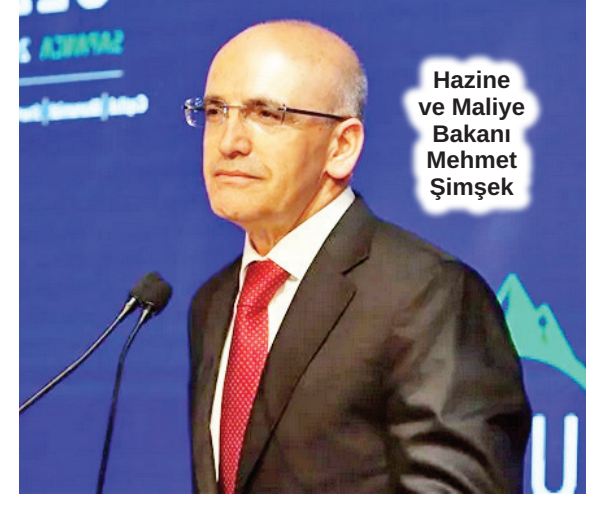
Hazine ve Maliye Bakanı Mehmet Şimşek

Gazeteciler Cemiyeti tarafından düzenlenen "Gazeteciliğin Dönüşümü ve Arayışlar" başlıklı medya konferansının ilk günü, Ankara TBB (Türkiye Barolar Birliği) Konuk Evi Litai Otel'de geniş katılımıyla gerçekleşti. Gazeteciler, hukukçular ve akademisyenlerin bir araya geldiği organizasyonda yeni basın kanunu çerçevesinde yaşanan sorunlar, "sansür yasası" suçlamaları, gazetecilerin çalışma yaşamı ve hakları, yapay zekâ uygulamaları, Filistinli gazetecilerle ve tutuklanan basın çalışanlarıyla dayanışma gibi konular ele alındı