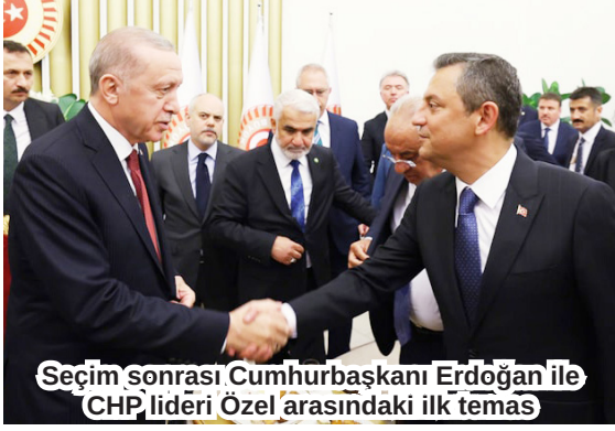
Seçim sonrası Cumhurbaşkanı Erdoğan ile CHP lideri Özel arasındaki ilk temas

Cumhurbaşkanı Erdoğan ve CHP lideri Özel, TBMM'nin 104'ncü açılış yıl dönümü ve 23 Nisan Ulusal Egemenlik ve Çocuk Bayramı nedeniyle, Meclis Başkanı Numan Kurtulmuş'un ev sahipliğinde düzenlenen resepsiyonda bir araya geldi. Erdoğan ve Özel'in seçim sonrası bayram vesilesiyle gerçekleşen ilk temaslarında birlikte çay içmeleri hemen herkesin içini ferahlatan, özlenen bir tabloydu.