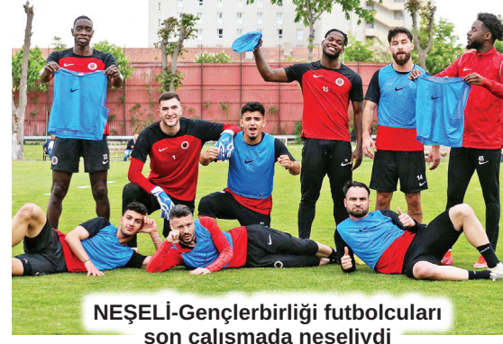
NEŞELİ-Gençlerbirliği futbolcuları son çalışmada neşeliydi