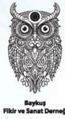
Baykuş Fikir ve Sanat Derneği

T.C. İÇİŞLERİ BAKANLIĞI SİVİL TOPLUMLA İLİŞKİLER GENEL MÜDÜRLÜĞÜ