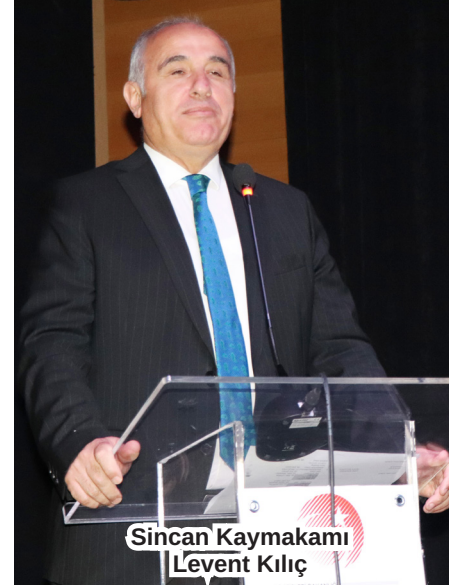
Sincan Kaymakamı Levent Kılıç