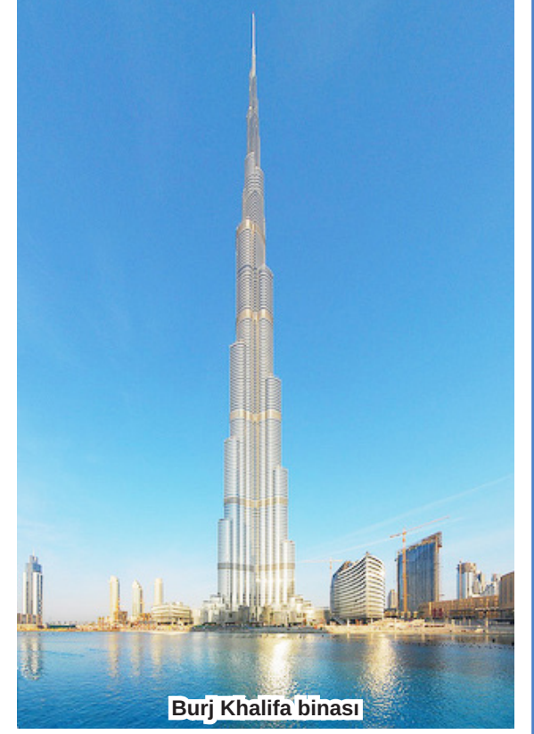
Burj Khalifa binası

aileler, İngiliz lordları gibi eğitim görmüş insanlardan oluşuyordu! İşte tam da bu noktada kanımızca bilim bitti ve o yörelin insanının özü ortaya çıktı. İngiliz akılla devasa kentler oluşturup, çölde yaşayan kabile akılla altyapıyı geçiştirip üstüne üstlük kuraklık var diyerek hesapsızca bulut tohumlama yapınca sonuç bu oldu! Tüm dikta rejimleri, prenslik ya da emirliklerde olduğu gibi baştaki adamın verdiği talimatlar sorgu-sual edilmeden harfiyen yerine getirildiği için, duvara toslamak kaçınılmaz oluyor. Burada da yetersiz altyapıya rağmen, Emir'in emri yerine getirilecek telaşla bulut tohumlama yönteminden kantarın topuzu kaçınca bu korkunç tablo ortaya çıktı. Hacı Bektaş-ı Veli'nin altını çizdiği gibi, "Bilimden gidilmeyen yolun sonu karanlıktır."