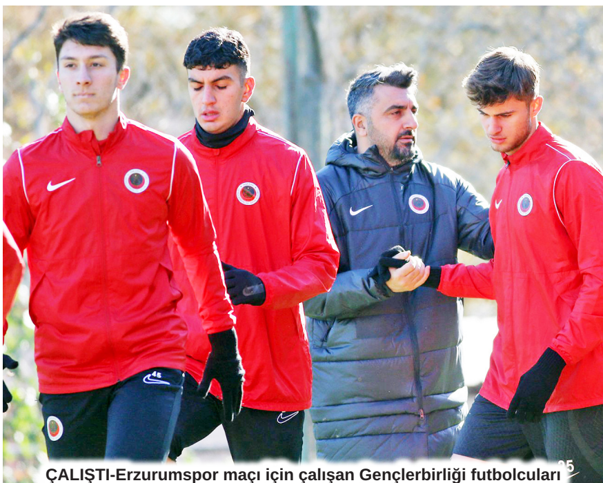
ÇALIŞTI-Erzurumspor maçı için çalışan Gençlerbirliği futbolcuları