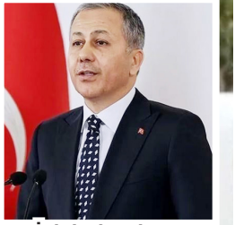
İçişleri Bakanı Ali Yerlikaya