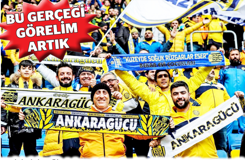
ESKİSİ GİBİ DEĞİL-Ankaragücü taraftarı bile tribünleri, doldurmuyor artık

Şu ana kadar Süper Lig izleyenlerinin ortalaması sayısı 11.859 olurken, bu rakam Almanya 2. ligindeki tribünün bile çok gerisinde kaldı